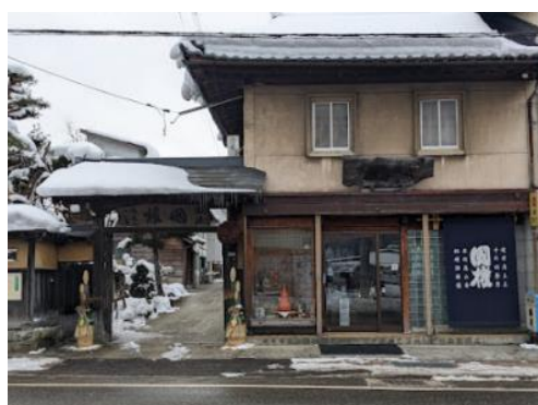
△南会津町 国権酒造