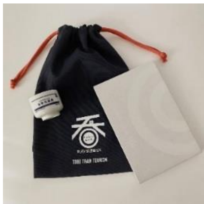
△#ふら呑みセット(イメージ)