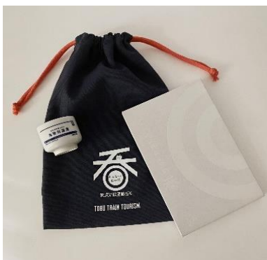
△#ふら呑みセット(イメージ)