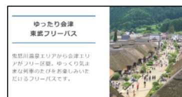
△お得なフリーパス